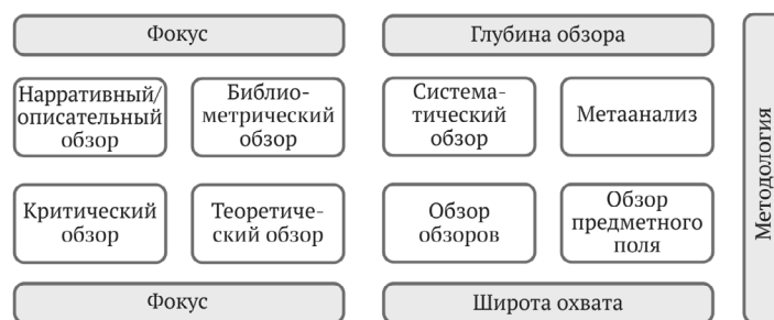
Рис. 1. Типология обзоров Fig. 1. Typology of reviews