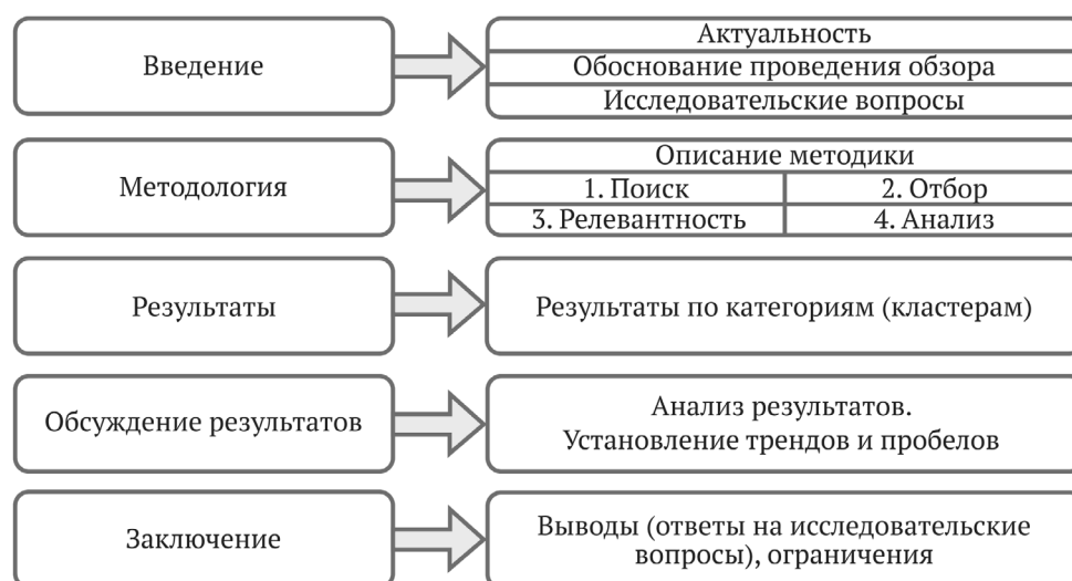
Рис. 4. Структура систематического обзора: риторическое содержание основных частей